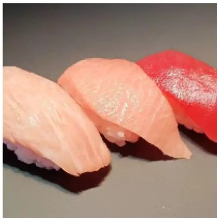
① 握り寿司3貫 (本マグロ赤身、トロ)